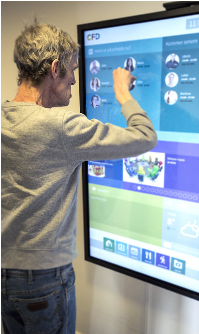
Borger afprøver galleriet på Interaktiv Borgerguide.